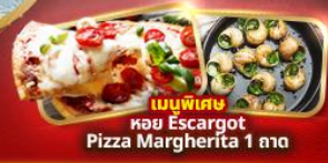
เมนูพิเศษ หอย Escargot Pizza Margherita 1 ถาด

อิตาลี มหาวิหารดูโอโม ชมสิ่งมหัศจรรย์ของโลก โคลอสเซียม หอเอนปิซ่า สวิส พิชิตยอดเขาจุงเฟรา "TOP OF EUROPE" สะพานไม้ชาเปล รูปปั้นสิงโต ฝรั่งเศส เข็ควินปารีส หอไอเฟล ประตูชัยฝรั่งเศส นั่งรถกระเช้าไฟฟ้ามงต์มาตร์ ล่องเรือแม่น้ำแซนชมเมือง ซ็อบบิงแบรนต์เนมห้างปลอดภาษี เอาท์เล็ท