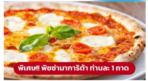
พิเศษ!! พิซซ่ามาการิตต้า ท่านละ 1 ถาด

เที่ยง ๑๐ รับประทานอาหารเที่ยง (มื้อที่1) เมนูพิเศษ!! พิซซ่ามาการิตต้า นำท่านเดินทางสู่ เมืองเวนิสเมสเตร (Venice Mestre) (ระยะทาง 264 ก.ม. / 4 ชม.) เป็นย่านเมืองเก่าแก่ที่มีความสวยงามและแสดงให้เห็นถึงความ เป็นอิตาเลียนขนานแท้