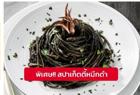
พิเศษ!! สปาเก็ตตี้หมึกดำ

Highlight ! เมื่อเยือนเกาะเวนิส เมนูที่ขึ้นชื่อและหากได้มาต้องได้ลิ้มลอง สปาเก็ตตี้ผัดซอสหมึกดำที่คลุกเคล้ากับความหอมนุ่มนวลกับบรรยากาศสุดคลาสสิคฉบับอิตาเลียนต้นตำรับเวนิส