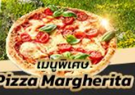
เมนูพิเศษ Pizza Margherita

นั่งรถไฟสายโรแมนติก Bernina Express มหาวิหารเซนต์กิลเลน ชมหมู่บ้านซานตา แมดดาเลนา วิหารโบสซาโน St. Magdalena อุทยานมรดกโลกโดโลไมต์ Misurina Lake ทะเลสาบที่มีวิวเทือกเขาโดโลไมต์