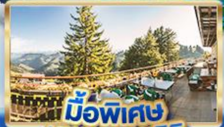
มือพิเศษ บินยอดเขาริธิ