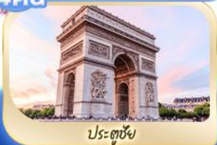
ประตูชัย