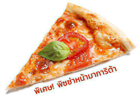
พิเศษ! พิซซ่าหน้ามาการิต้า

นำท่านเดินทางสู่ เมืองโคโม (Como) (ระยะทาง 51 กม. / 45 นาที) ตั้งอยู่บริเวณพรมแดนกับประเทศสวิตเซอร์แลนด์ โคโมเป็นเมืองที่ตั้งอยู่ในเทือกเขาแอลป์ พาทุกท่านไปเก็บภาพความประทับใจกับ ทะเลสาบโคโม (Lake Como) ขึ้นชื่อว่าเป็นทะเลสาบที่สวยงามที่สุดในโลก มีรูปร่างลักษณะเฉพาะของทะเลสาบโคโมทำให้นึกถึง Y ที่กลับด้านที่โด่งดังไปทั่วโลก เป็นผลมาจากการละลายของธารน้ำแข็งรวมกับการกัดเซาะของแม่น้ำ Adda โบราณ ทำให้เกิดทางแยกเป็นตัว Y และยังเป็นทะเลสาบมีทิวทัศน์ที่งดงามที่สุดแห่งหนึ่งในโลก