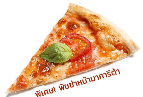
พิเศษ! พิซซ่าหน้ามาการิตต้า

นำท่านเดินทางสู่ เมืองโคโม (Como) (ระยะทาง 51 กม. / 1 ชม. นาที) ตั้งอยู่บริเวณพรมแดนกับประเทศสวิตเซอร์แลนด์ โคโมเป็นเมืองที่ตั้งอยู่ในเทือกเขาแอลป์ พาทุกท่านไปเก็บภาพความประทับใจกับ ทะเลสาบโคโม (Lake Como) ขึ้นชื่อว่าเป็นทะเลสาบที่สวยงามที่สุดในโลก มีรูปร่างลักษณะเฉพาะของทะเลสาบโคโมทำให้นึกถึง Y ที่กลับด้านที่โด่งดังไปทั่วโลก เป็นผลมาจากการละลายของธารน้ำแข็งรวมกับการกัดเซาะของแม่น้ำ Adda โบราณ ทำให้เกิดทางแยกเป็นตัวย Y และยังเป็นทะเลสาบมีทิวทัศน์ที่งดงามที่สุดแห่งหนึ่งในโลก