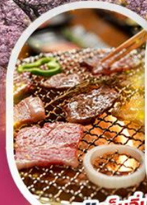
พิเศษ!! เติมอิ่ม ปิ้งย่าง Yakiniku Buffet

เที่ยวญี่ปุ่น.. โอซาก้า ทาคายาม่า ชิราคาวาโกะ นานานะโอะซาโตะ