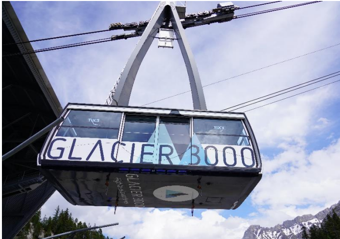
Highlight ! กระเช้าไฟฟ้าขนาดยักษ์ที่จุผู้โดยสารได้ถึง 125 คน

นำท่านเดินทางสู่ หมู่บ้านโคล เดอ ปียง (Col De Pillon) เป็นที่ตั้งของสถานี นำท่านนั่งกระเช้าลอยฟ้า สู่ ยอดเขากลาเซียร์ 3000 (Glacier 3000) มีความสูงเกือบ 3,000 เมตรเหนือระดับน้ำทะเล ชมทิวทัศน์อันงดงามของท้องฟ้าและเทือกเขามากมายแบบพาโนรามา และให้ท่านท้าทายความสูงเดินบน "The Peak Walk by Tissot" สะพานแขวนที่มีความยาว 107 เมตรข้ามหน้าผาที่ระดับความสูง 3,000 เมตร ทำให้เป็นสะพานแขวนที่สูงที่สุดในโลก