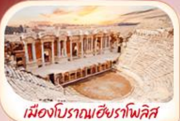
เมืองโบราณเฮียราโพลิส