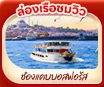
ล่องเรือชมวิว

พิเศษ! ล่องเรือชมความสวยงามช่องแคบ 2 ทวีป "ช่องแคบบอสฟอรัส"