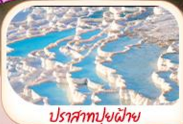
ปราสาทปูยฝ้าย