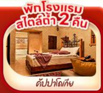
พักรองแรม สไตล์ดี 2 คืน